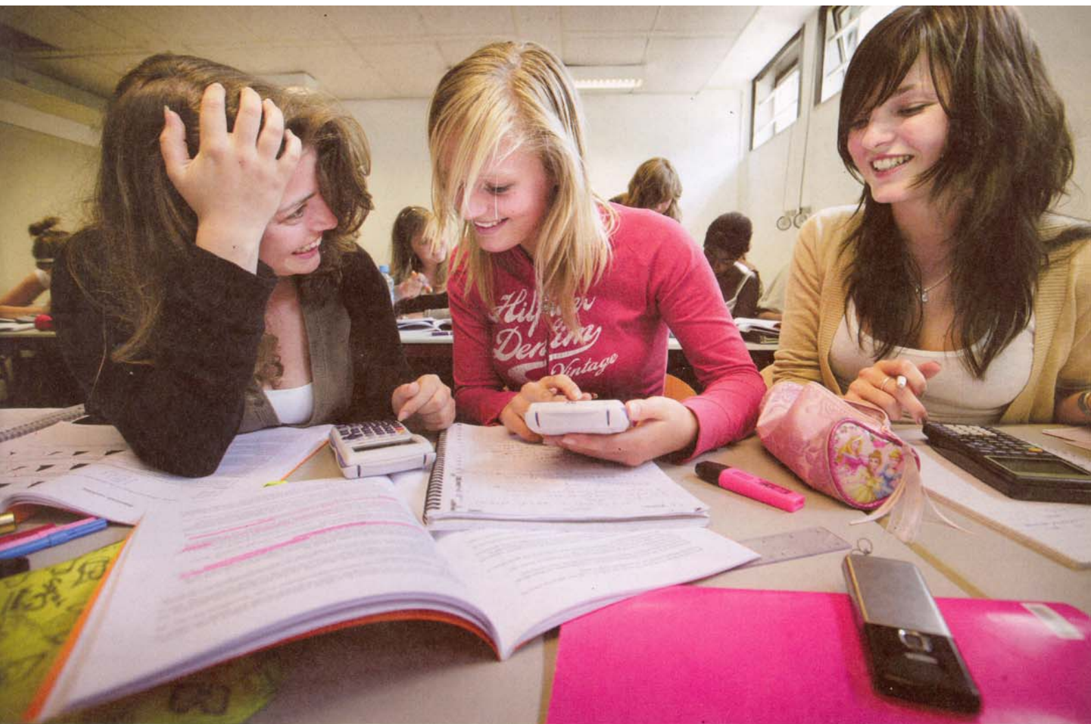
Vorbereiding op het eindexamen aan de Universiteit Leiden: studeren zonder msn, zonder tv, en met begeleiders die vaak maar een paar jaar ouder zijn dan hun leerlingen